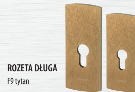
ROZETA DŁUGA F9 tytan