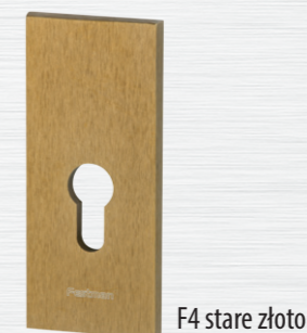
F4 stare złoto