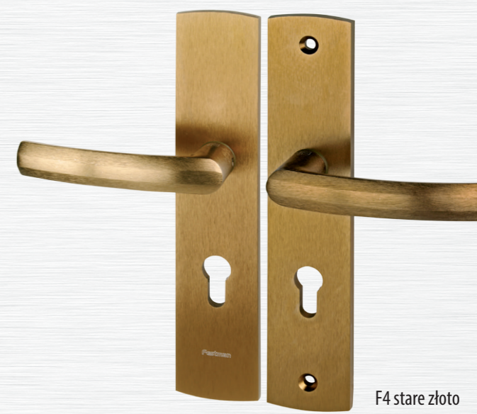
F4 stare złoto