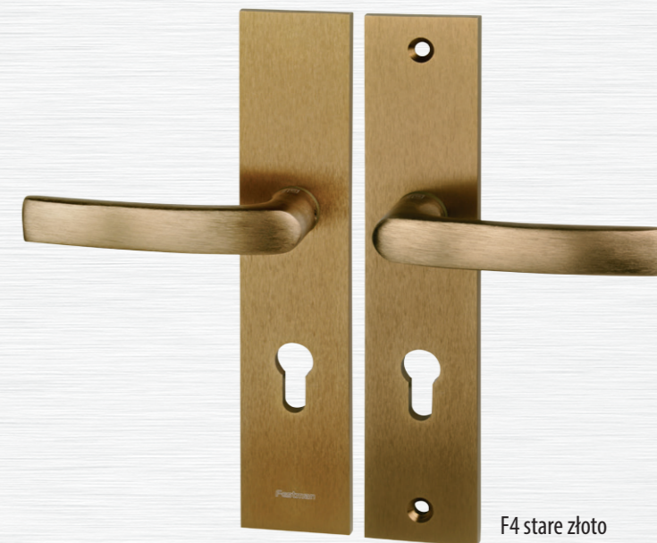
F4 stare złoto