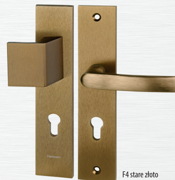
F4 stare złoto