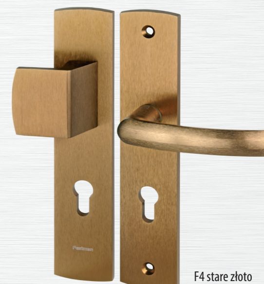
F4 stare złoto