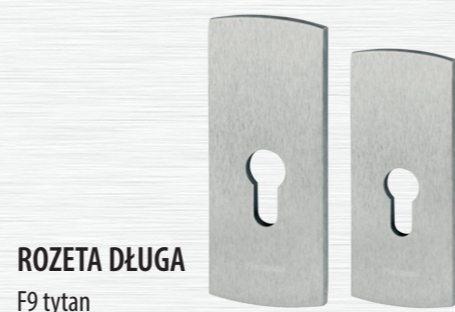
ROZETA DŁUGA F9 tytan